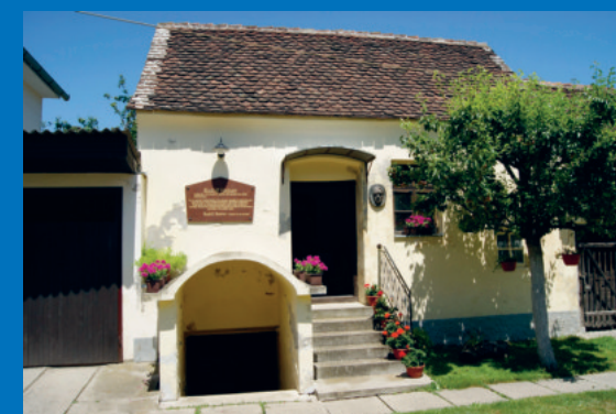
Geburtshaus Rudolf Steiners, Donji Kraljevec

anthrosana Postplatz 5 | Postfach 128 | 4144 Arlesheim T 061 701 15 14 | info@anthrosana.ch | www.anthrosana.ch